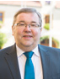
Schnaittenbach, im Dezember 2016

Verehrte Mitbürgerinnen und Mitbürger, verehrte Leserinnen und Leser unseres „Schnaittenbach aktuell“,