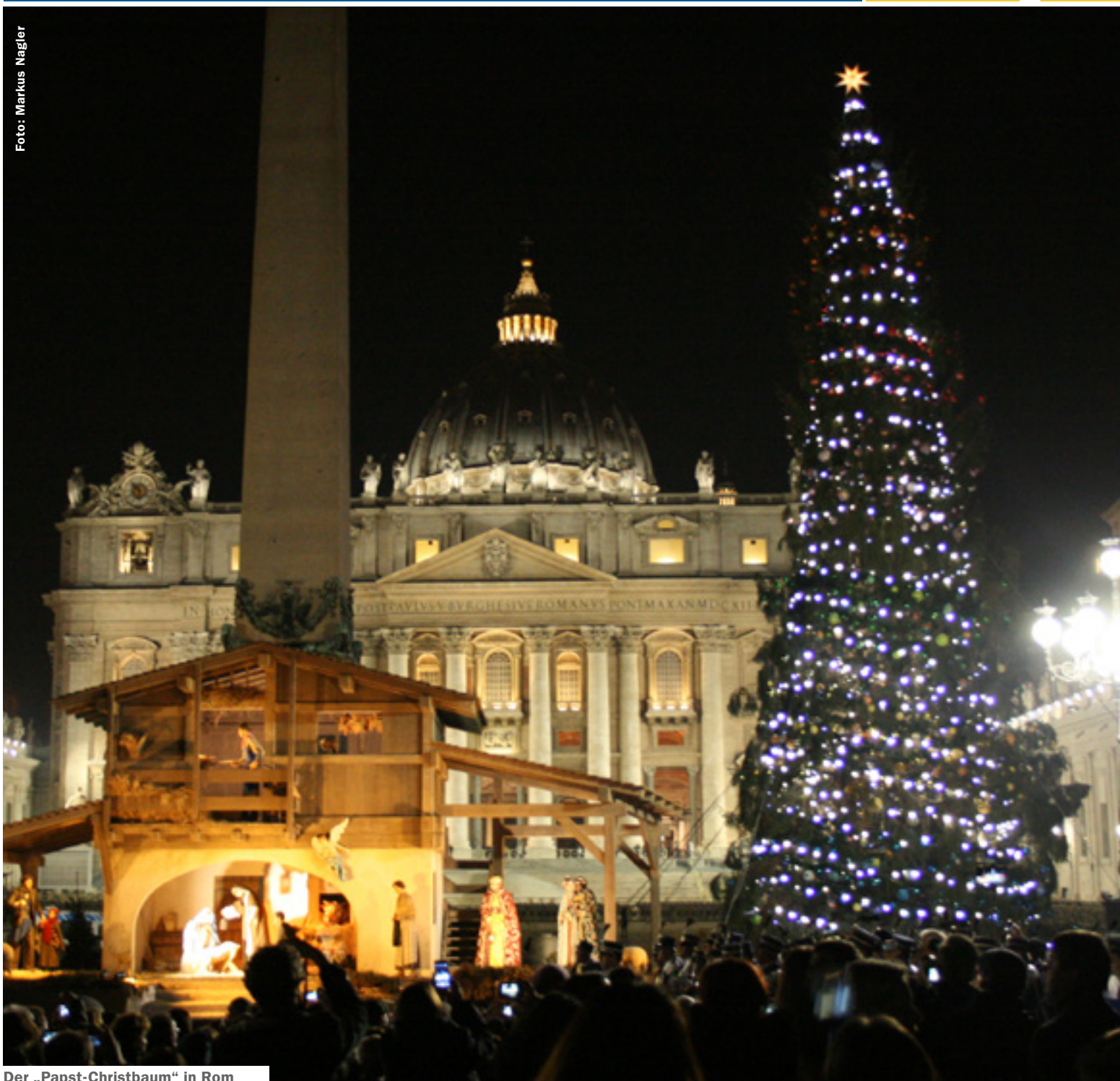
Der „Papst-Christbaum“ in Rom