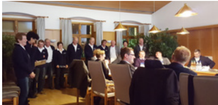
Mit Freude und Stolz verfolgten zahlreiche Vereinsmitglieder des SCmBf die Verleihung des Heimat- und Kulturpreises 2016 im Sitzungssaal des Rathauses.

Der Sängerclub mit Badefreuden erhielt in der Weihnachtssitzung des Stadtrates den Heimat- und Kulturpreis 2016 der Stadt Schnaittenbach. Diese Auszeichnung wurde bisher nur 7 Mal verliehen.