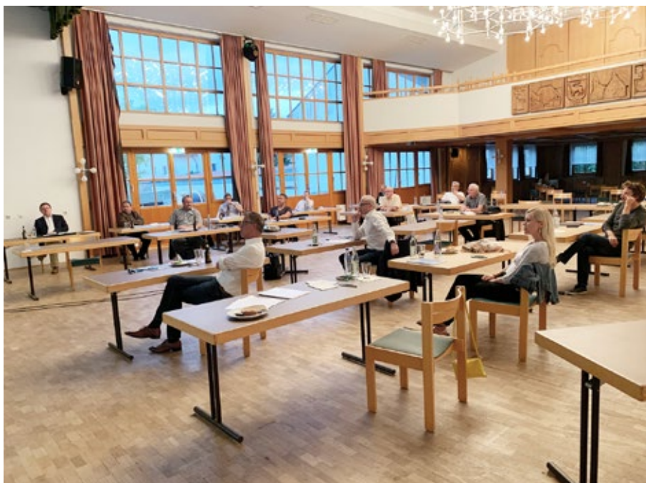
Die TeilnehmerInnen der Steuerungsgruppe machen sich Gedanken zur zukünftigen Ausrichtung der Integrierten Ländlichen Entwicklung AOVE.

Neues Entwicklungskonzept der AOVE so aktuell wie nie: